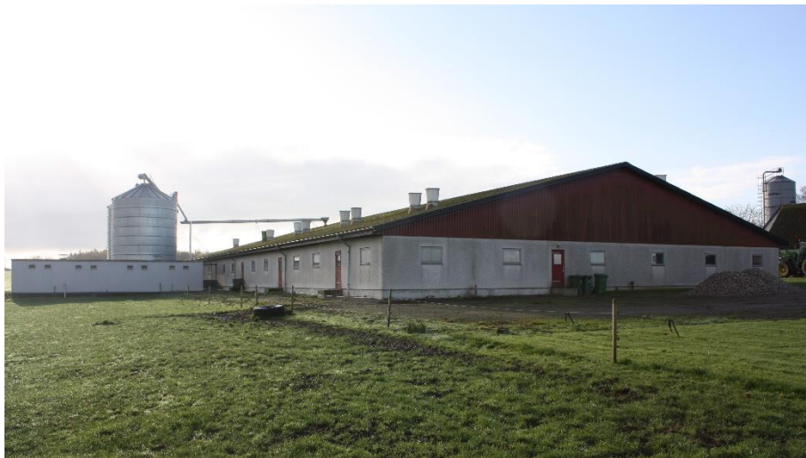
Figur 3 Skovlukkegård

Opvarmning ske med gulvvarme med oliefyr som kilde. I de første dage efter vask og indsætning af et nyt hold suppleres med transportabel elvarmeblæser.