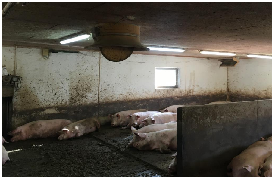
Figur 7 Drægtighedsstald

Denne type ventilatorer er triak-styrede, hvilket giver et stort strømstab ved dellast. Det betyder, at bortset fra tiden hvor ventilatoren kører med maksimal ydelse, vil der være en stor strømbesparelse.